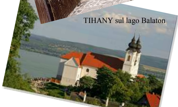
TIHANY sul lago Balaton